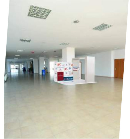
İletişim Bilimleri Fakültesi

Yunus Emre Kampüsümüzü dilerseniz 3 boyutlu dilerseniz 360° Kampüs özelliğiyle gezebilirsiniz.